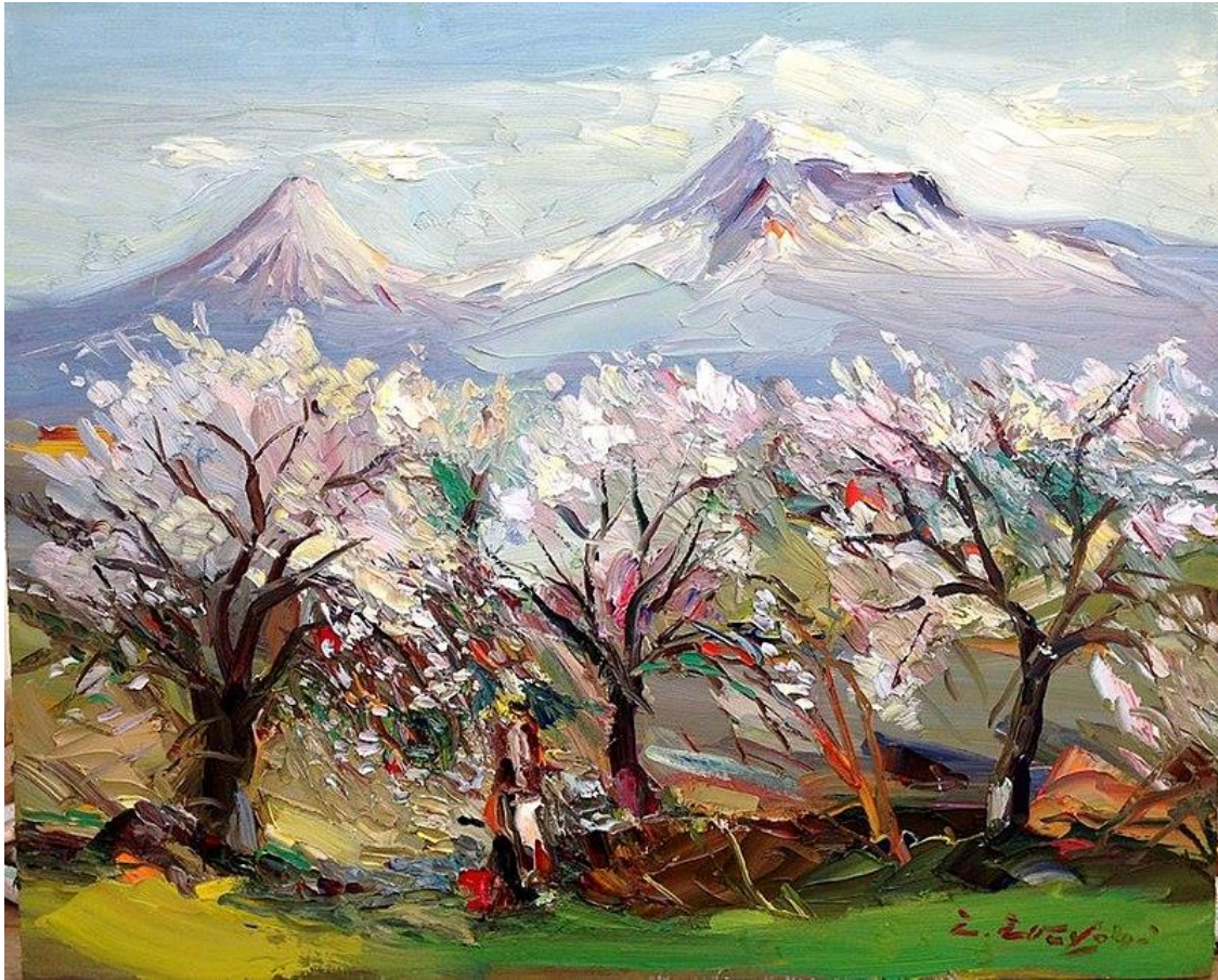
Արարատը գարնանը՝ Արարատյան դաշտից

Հիմնադրամիս հոգաբարձության խորհրդի որոշմամբ «Բարեգործի» այս և հաջորդ համարներում կտպագրվեն ՀՀ վաստակավոր նկարիչ, հոգաբարձության խորհրդի անդամ, նվիրյալ բարերար Շմավոն Շմավոնյանի գեղանկարներից: