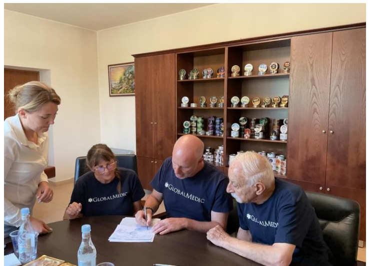
At "EcoFood" factory, signing a contract