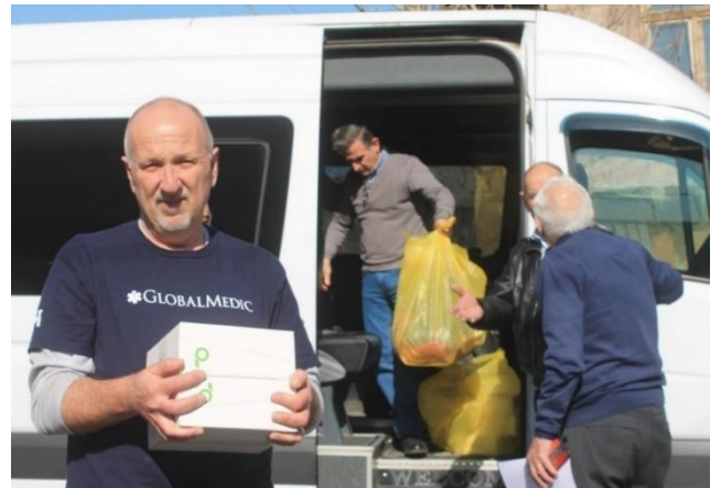
Ստեֆանը "ԷկոՖուդ"-ի արկղերով

Հաջողություն Ձեր ազգանվեր ու հայրենանվեր գործին: Հաճախ եկեք Հայաստան: