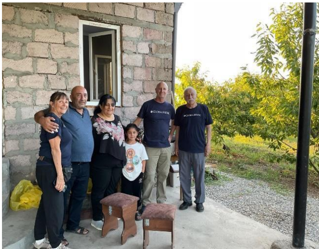
With Ordubekian family-9 children