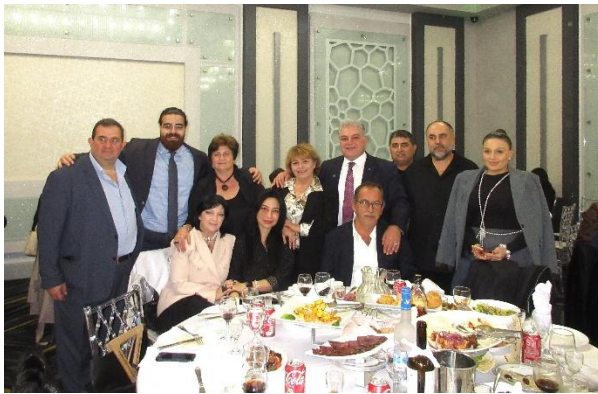
Invitees at the Fundraising event

Due to the 44-day war in Artsakh, our brothers and sisters were forcibly displaced from their millennia-old homeland, spreading into the border regions and cities of the Republic of Armenia. Now, the foundation faces new challenges to urgently assist our compatriots. With great responsibility, the Foundation has committed itself to this cause.