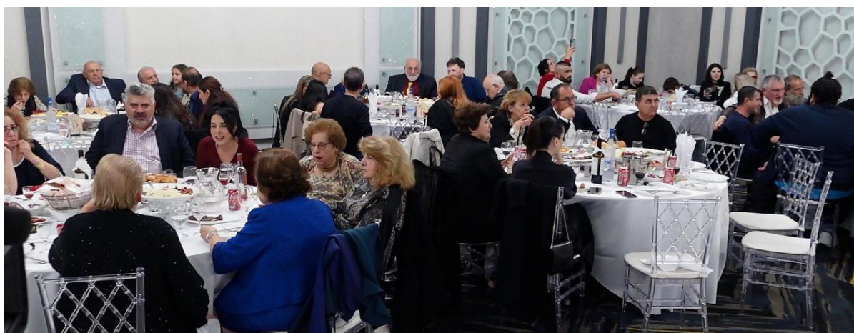
Դրվագ Նորթ Յոլիվուդի «Բելլեգա» սրահում կայացած դրամահավաքից

ՊՆՇՏՈՆԱԾԵՐԹ «ԳՈՒՐԳԵՆ ՄԵԼԻՔՅԱՆԻ՝ ՔԱՇԱԾԱՂԻ ԲԱԶՄԱԶՎԱԿ ԸՆՏԱՆԻՔՆԵՐԻ ՀԻՄՆԱԳՐԱՄԻ» BAREGORTS, հունվար – մարտ, 2026, № 1 (69-70), БАРЕГОРЦ