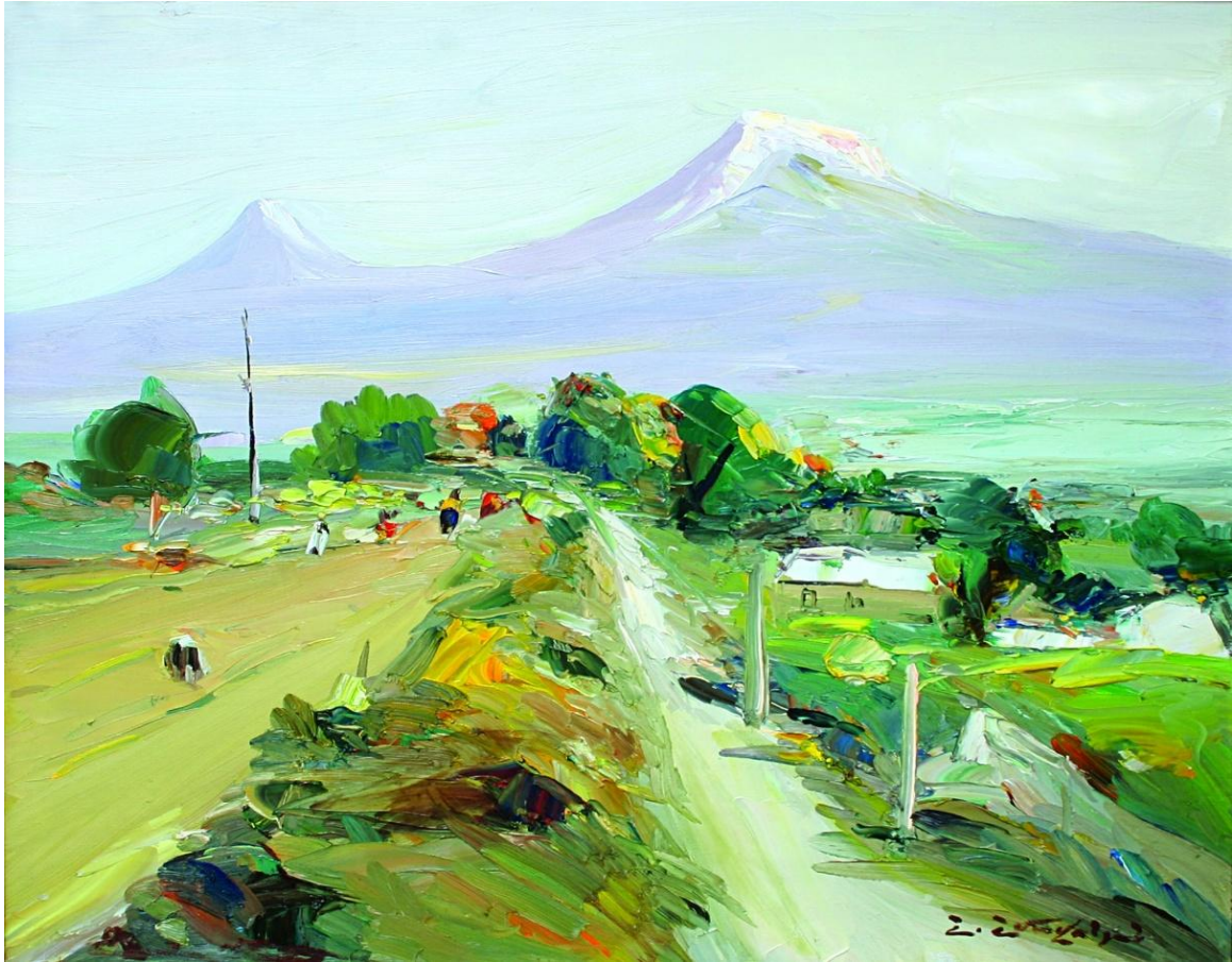
ՀՀ վաստակավոր նկարիչ Շմավոն Շմավոնյանի «Արարատ»-ներից մեկը:

ԳԼԽԱՎՈՐ ԽՄԲԱԳԻՐ՝ ՄՈՒՐԱԴՅԱՆ Ս. Պ. , բան. գիտ. դոկտոր, պրոֆեսոր