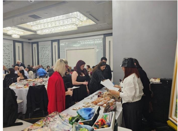
Bazar sale at the event