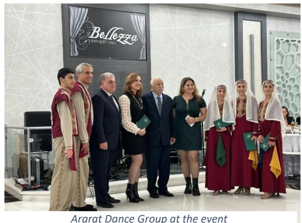
Ararat Dance Group at the event

The attendees watched a video presentation about «Global Medic», a Canadian charitable organization, and learned about the assistance they provide. The speech by Melikyan's grandson in both Armenian and English was touching, where the young man emphasized that he would lovingly continue the duty passed down