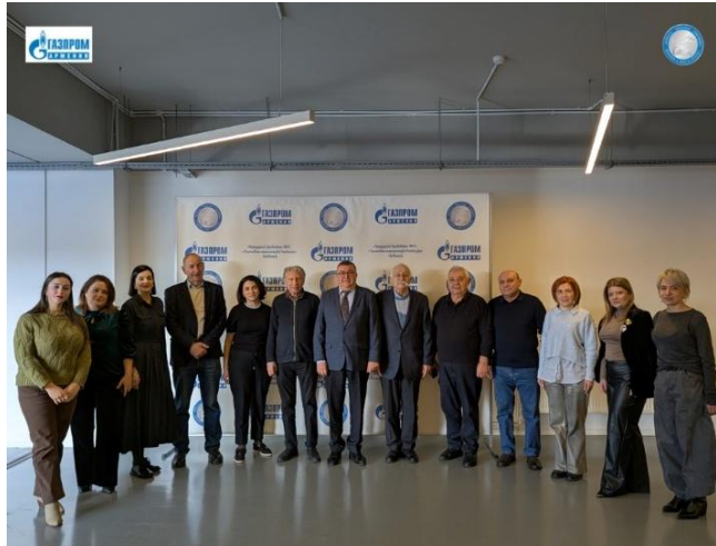
Հանդիպման օրվա հիշատակի նկար