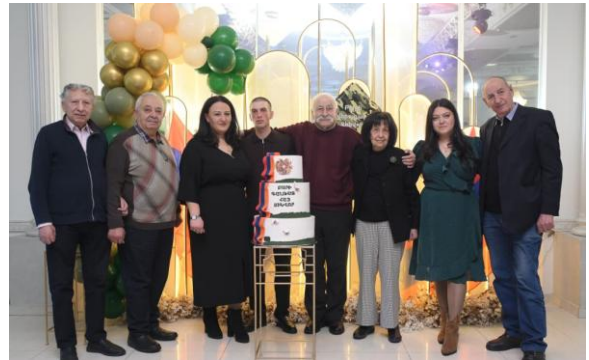
Հիշատակի նկար Չինվորի վերադարձի միջոցառումից

տոնախմբությունների ականատես ու մասնակից: Ձեր բարեխղճությունը և գործունեության արդյունավետությունը նկատի ունենալով՝ Հիմնադրամի հոգաբարձության խորհուրդը անցած դեկտեմբերի 26-ի նիստում շնորհավորելով Ձեր 80-ամյա հորեյանը՝ Ձեզ հանձնեց իր շնորհակալագիրը և «Էջմիածնի սուրբ մասունքները» պարգևը: